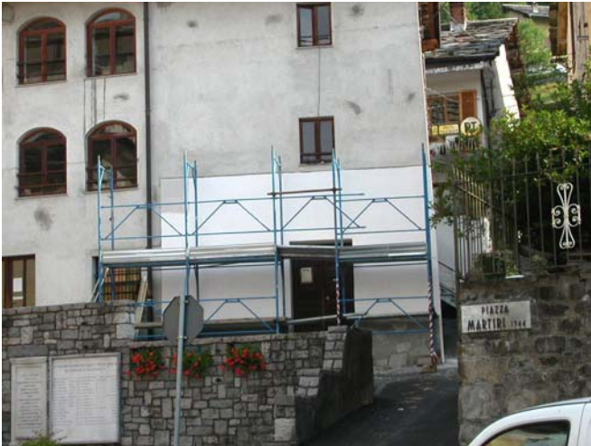
La parete, 5 luglio 2004.