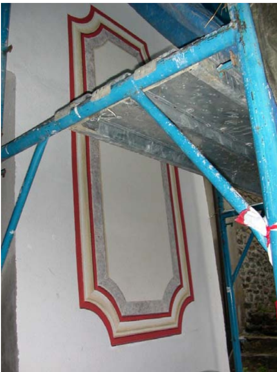
L'inizio dei lavori, 7 luglio 2004: